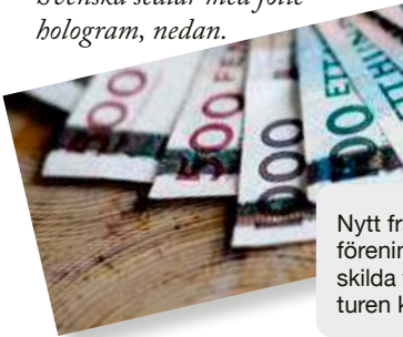
Svenska sedlar med folie-hologram, nedan.