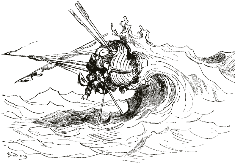
ILLUSTRATION: GUSTAVE DORÉ