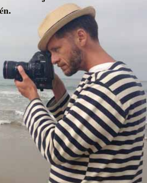
FOTO: REBECCA ERICZÉN / INFÄLLDA SKÄRMDUMPAR: STATEOFSTYLE.COM &amp; YOUTUBE.COM

När Nytt från Media ringer upp mediamedlemmen Bobo Ericzén sitter han i möte. Bobos företag Barracuda Film & TV ska lämna ett förslag till SvT om en fortsättning på modedokumentarserien State of Style som SvT visat under namnet Fashion i tio säsonger.