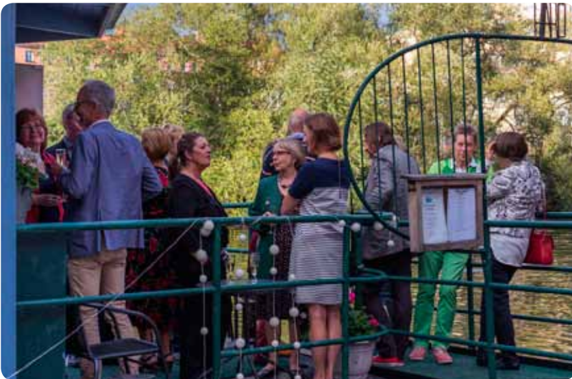
Jubileumskvällen inleddes med bubbel och mingel. Sedan avlöste telegramuppläsning, mat, musiktävling och många samtal runt borden varandra.